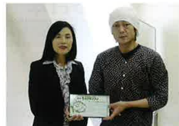
戸塚実行委員長と小宮さん