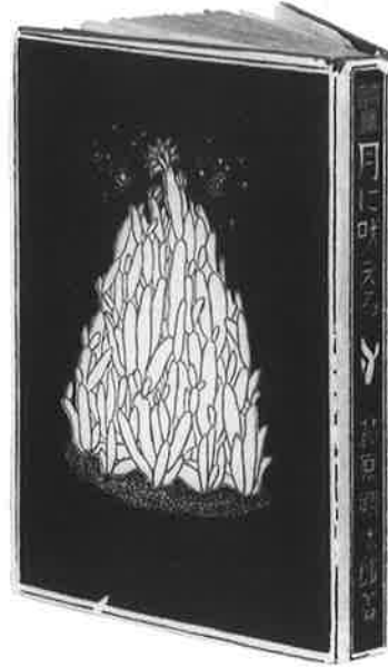
萩原朔太郎『月に吠える』無削除本 1917(大正6)年2月 県立神奈川近代文学館蔵