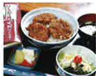
第1回グランプリ おそば屋さんのソースかつ丼 (そば処 大村 総社)