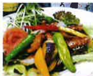
第3回グランプリ 名店仕込の黒酢豚 (厳選地酒と本格焼酎の店 海人)