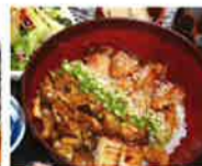
第6回グランプリ 麦豚とキノコのくわ焼き丼 (和食遊処 椿家 川原店)