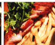
第8回グランプリ 上州麦豚の厚切りローストポーグ (29食系直球居酒屋 RIVER)