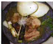
第2回グランプリ 塩豚まんじゅう (居酒屋こみざん。)