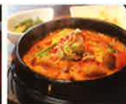
第7回グランプリ もちゅ煮 (きむち屋)