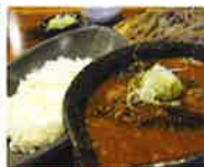
第4回グランプリ 豚咖喱セット (蕎麦山海酒屋 山人)