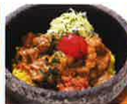
第5回グランプリ まえとん咖喱飯 (欧州料理 ヴォレ・シーニユ)