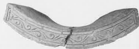
上野国分寺出土瓦「住谷コレクション」