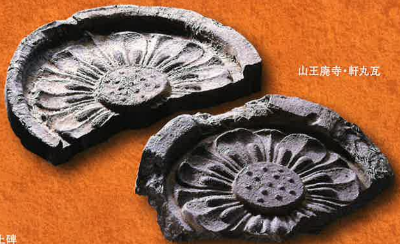
山王庵寺・軒丸瓦