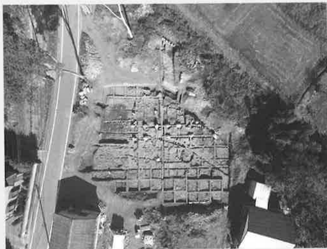
多胡郡正倉跡 大型礎石建物写真

前橋・高崎連携事業文化財展は平成19年度より両市の所有する文化財を広く紹介し、多くの方々に文化財への理解を深めてもらおうと、両市に会場を設け、毎年テーマを変えて継続開催しています。