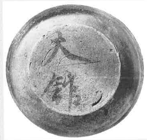
元総社蒼海遺跡群(26)「大館」墨書土器