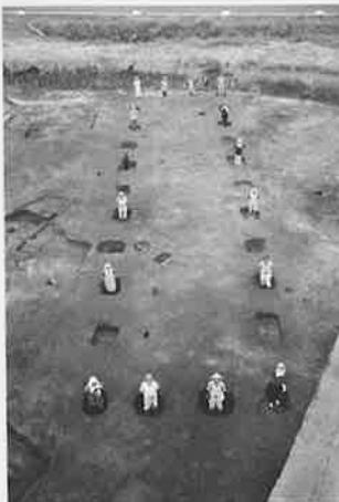
元総社蒼海遺跡群(9) 掘立柱建物跡