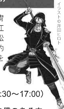
イラスト © 井田ヒロト

川越藩火縄銃鉄砲隊保存会が提供する甲冑を身にまとい、鉄砲隊の皆さんと共に、臨江閣を出発。前橋東照宮を經由し、お客様や松平大和守家現当主が待つ前橋公園までの約500mを行進します。御手杵の槍(複製)を持って歩くチャンスもあります。