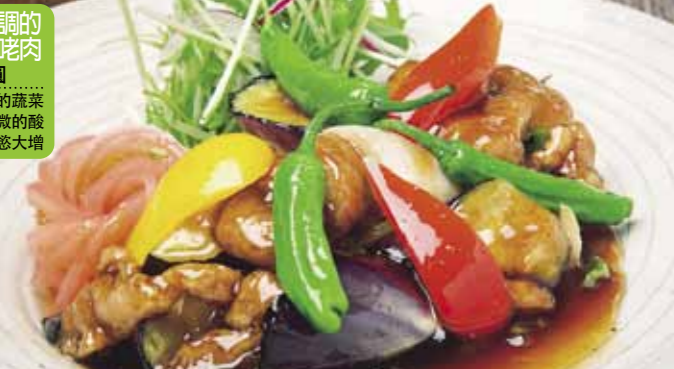
名店烹調的黑醋咕咕肉 1260日圓 色彩鮮豔的蔬菜與黑醋微微的酸味讓人食慾大增