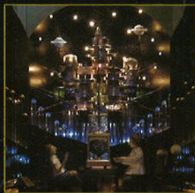
ギフト・フロム・ダディ