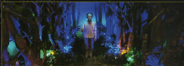
アンダー・ザ・ウッズ