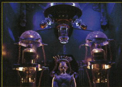
シグナル・メモリー

1956年神奈川県横浜市に生まれる。1979年創形美術学校研究科修了。1980年代半ばより、油彩画と並行し立体作品の制作を始める。音と光と人形達の織りなす幻想的な作品世界が高い評価を受け、全国で大規模なイベントを開催。2007-2010年、大阪成蹊大学芸術学部客員教授。近年の主な展覧会に「蜘蛛の糸」展(2016年、豊田市美術館、愛知)、「ムットーニ・パラダイス」(2017年、世田谷文学館、東京)、「ムットーニワールド からくりシアターⅣ」(2018年、八王子市夢美術館、東京)、「ムットーニシアター in HANKYU」(2019年、阪急うめだホール、大阪)「ムットーニからくりシアター展～機械仕掛けのパラダイスへようこそ～」(2020年、藤枝市郷土博物館・文学館、静岡)、「ムットーニのオルゴールシアター」(2020年、六甲オルゴールミュージアム、兵庫)など。