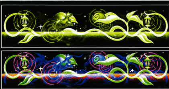
The Fox, The Folks "HORIZON TAIL"