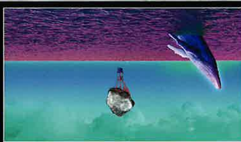
DecideKit "The Hidden Beauty"