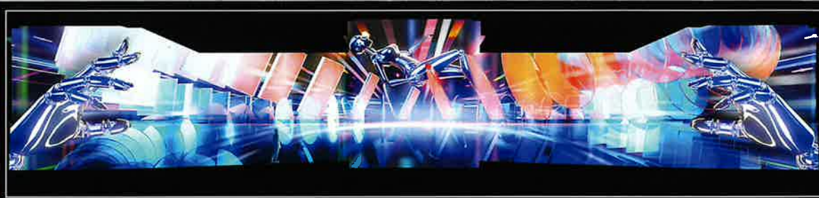
Rampages Production "Metaform"