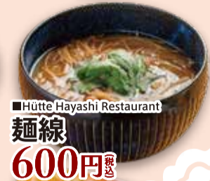
■Hütte Hayashi Restaurant 麺線 600円