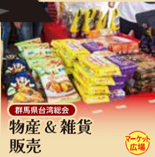
群馬県台湾総会 物産&雑貨 販売