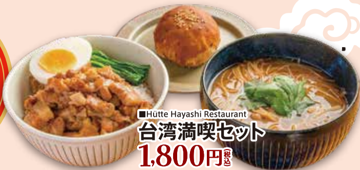
■Hütte Hayashi Restaurant 台湾満喫セット 1,800円