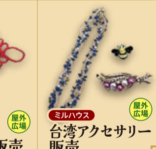
群馬県台湾総会 伝統の 台湾結び販売