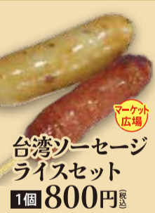
台湾ソーセージ ライスセット 1個 800円