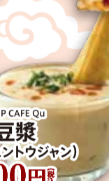
■SHOP CAFE Qu 鹹豆漿 (シェントウジャン) 500円