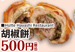
■Hütte Hayashi Restaurant 胡椒餅 500円