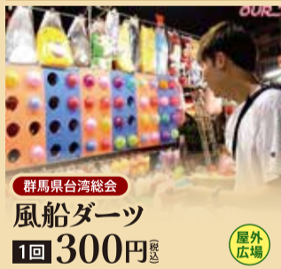
群馬県台湾総会 風船ダーツ 1回 300円