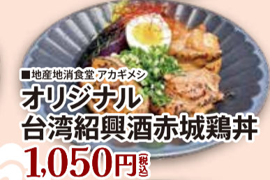
■地産地消費 アカギメン オリジナル 台湾紹興酒赤城鶏丼 1,050円