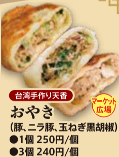
台湾手作り天香 おやき (豚、ニラ豚、玉ねぎ黒胡椒) ●1個 250円/個 ●3個 240円/個