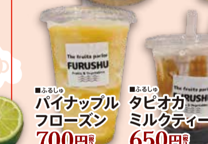
■ふるしゅ パイナップル フローズン 700円