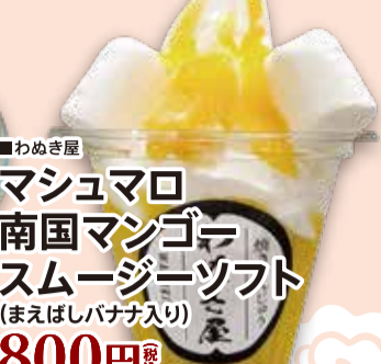
■わめき屋 マシュマロ 南国マンゴー スムージーソフト (まえばしバナナ入り) 800円