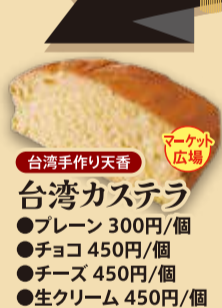
台湾手作り天香 台湾カステラ ●プレーン 300円/個 ●チョコ 450円/個 ●チーズ 450円/個 ●生クリーム 450円/個