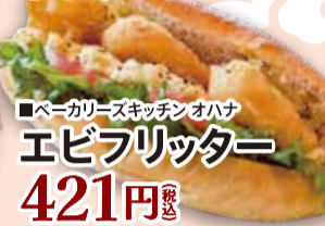
■ベーカリースキッチン オハナ エビフリッター 421円