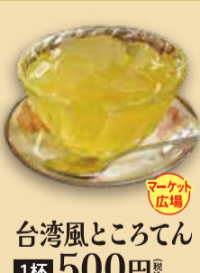
台湾風ところてん 1杯 500円