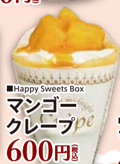
■Happy Sweets Box マンゴー クレープ 600円