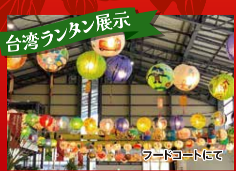
台湾ランタン展示