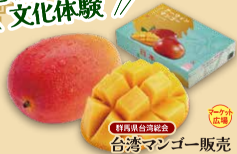
群馬県台湾総会 台湾マンゴー販売