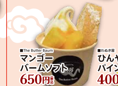
■The Butter Baum マンゴー バームソフト 650円