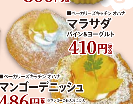
■ベーカリースキッチン オハナ マラサダ バイン&ヨーグルト 410円