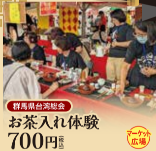
群馬県台湾総会 お茶入れ体験 700円