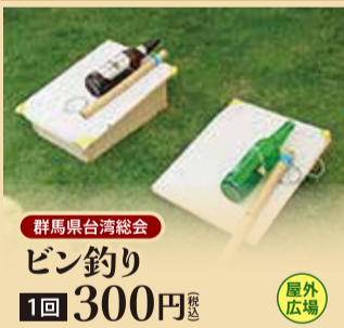
群馬県台湾総会 ビン釣り 1回 300円