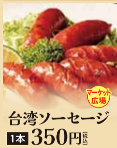
台湾ソーセージ 1本 350円