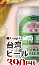
■Akagi FarmLife 台湾 ビール 390円