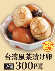
台湾風茶漬け卵 2個 300円