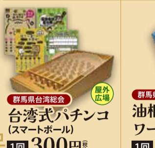
群馬県台湾総会 台湾式パチンコ (スマートボール) 1回 300円