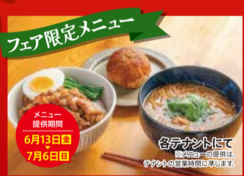
フェア限定メニュー