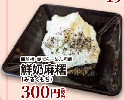
■前橋・赤城らーめん翔鶴 鮮奶麻糬 (みるくもち) 300円