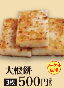
大根餅 3枚 500円