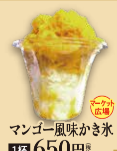
マンゴー風味かき氷 1杯 650円