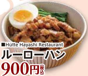
■Hütte Hayashi Restaurant ルーローハン 900円