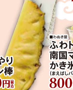
■わめき屋 ひんやり パイン棒 400円