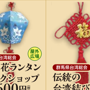
群馬県台湾総会 油桐花ランタン ワークショップ 1回 500円