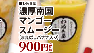
■わめき屋 濃厚南国 マンゴー スムージー (まえばしバナナ入り) 900円