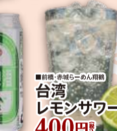
■前橋・赤城らーめん翔鶴 台湾 レモンサワー 400円