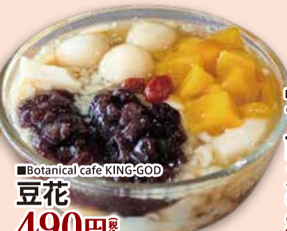
■Botanical cafe KING-GOD 豆花 490円