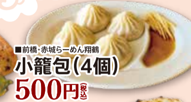
■前橋・赤城らーめん翔鶴 小籠包(4個) 500円