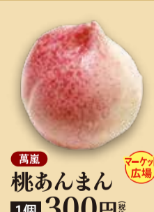
桃あんまん 1個 300円