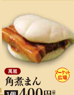
角煮まん 1個 400円