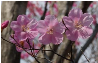
葉が出る前に咲きます

【申込み締切日】4月23日(木) 先着30名 上下セパレート雨具、防寒具、ダブルのトレッキングポールをご持参ください。 8:45～ 受付(大洞駐車場:ビジターセンター手前左WC有集合) 9:00～ (車で移動)=小沼P=長七郎山(右回り)=茶ノ木畑峠1,422m=横引尾根=茶ノ木畑峠= 15:00 小沼水門1,473.7m=小沼(右回り)=小沼P(車で移動)=大洞駐車場・解散