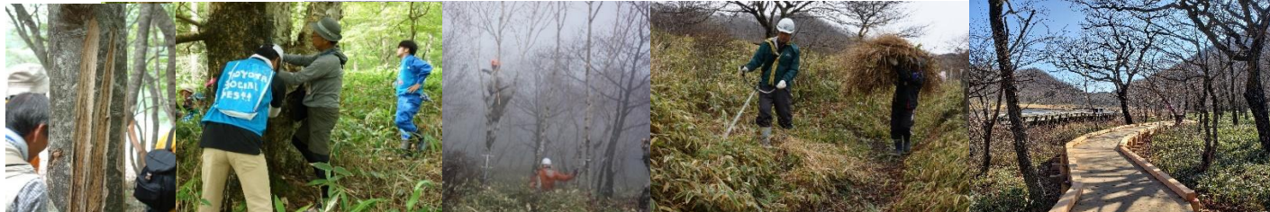
ニホンジカの食害 食害防止のネット巻き 眺望復元の為の枝払い ススキ・ササ刈り 遊歩道の補修とバリアフリー木道の新設

※赤城山山頂部のエコツーリズム推進エリアでは、自然保護・観光振興・地域振興・環境教育がバランス良く行われています。