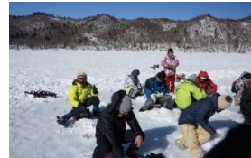
ワカサギの穴釣り(大沼)