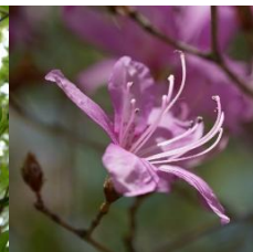
トウゴクミツバツツジ