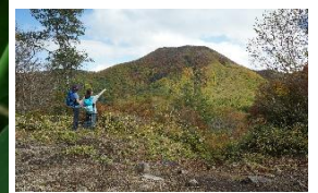
陣笠山から主峰黒檜山