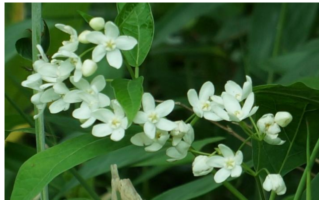
クサタチバナ（草橋）は田中澄江著『新・花の百名山』で紹介