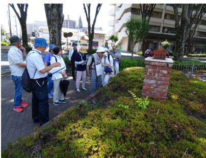
上毛倉庫若宮営業所跡 <R6. 6. 15>