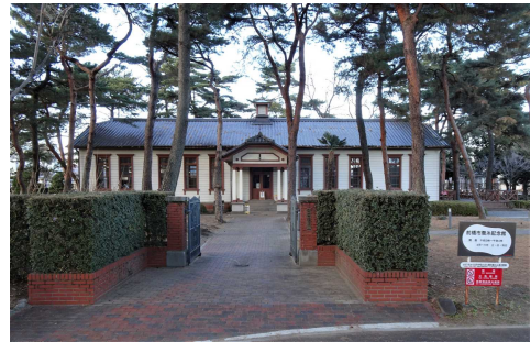
前橋市蚕糸記念館