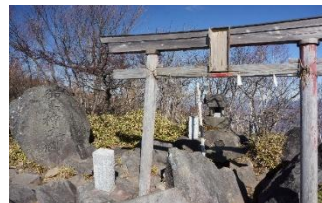
山頂南にある黒檜山大神