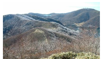
黒檜山から駒ヶ岳・地藏岳