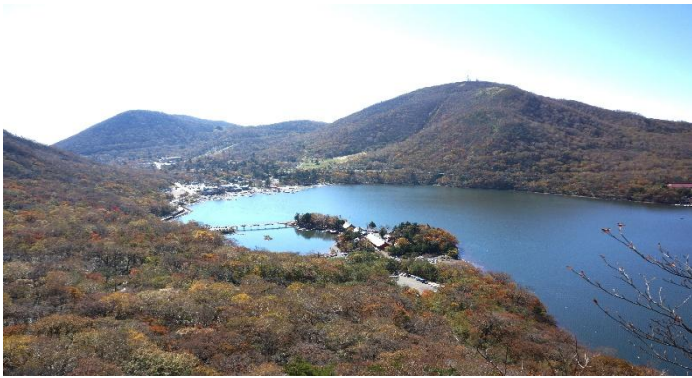
猫岩1,600mから大沼1,340.7m・赤城神社・地藏岳1,674m

8:45~ 受付(おのご駐車場WC有集合) 9:00~ VC=黒檜山登山口1,370m=猫岩1,600m=黒檜山山頂1,827.7m=展望台=赤城山大神1,819m= 15:00 大ダルミ1,619.7m=駒ヶ岳1,685m=麓山=鳥居峠1,391.4m=覚満淵1,360.6m=VC