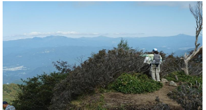
展望台から谷川連峰・上州武尊山・至仏山・燧ヶ岳・日光白根山2,578m