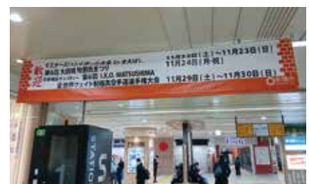
前橋駅構内に横断幕の設置

■参加者へノベルティを提供 前橋市の観光パンフレットやコングレスバッグ、 オリジナルクリアファイル、 「前橋の天然水アカギノメグミ」 などを提供。