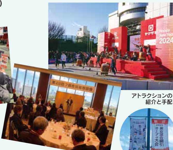
アトラクションの 紹介と手配