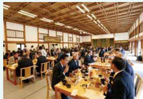
ユニークベニュー臨江閣の紹介