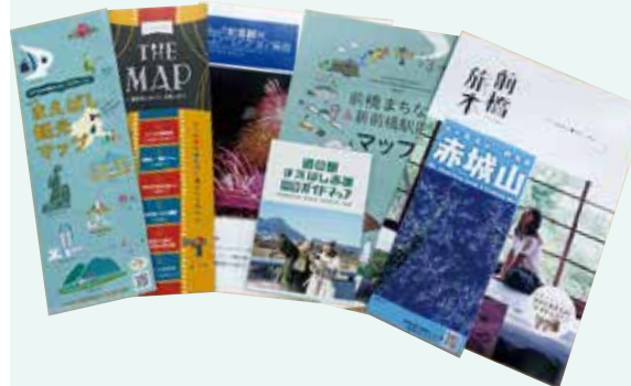
観光パンフレット、観光マップの作成・配布