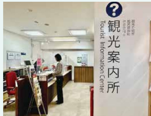
観光案内所 Tourist Information Center

■ JR 前橋駅観光案内所 JR 前橋駅構内にて、観光・イベント情報のご案内や各種パンフレットを設置。 前橋百貨内 TEL : 027-221-0167 営業時間 9:00 ~ 18:00