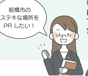
前橋市の ステキな場所を PRしたい!

各種イベントやお祭りの実施のほか、企業や行政機関と連携し、県内外で前橋市の観光PRや旅行商品の誘致活動などを実施。その他、来訪された方々への案内業務や観光パンフレットの作成・配布等を行っています。