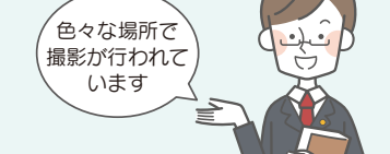
色々な場所で撮影が行われています