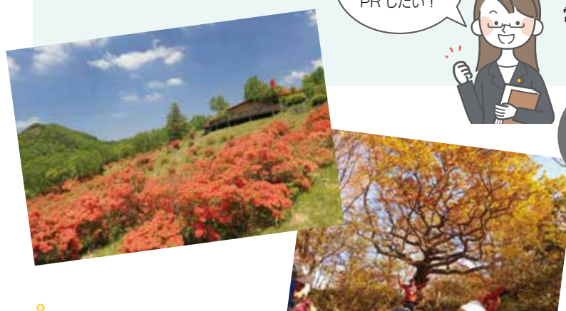
赤城白樺牧場秘密の絶景ツアー

■道の駅まえばし赤城観光案内所 前橋市を中心とした広域観光情報を提供。併設のショップでは、電動アシスト付き「e-Bike」貸出も。 道の駅まえばし赤城内 TEL : 027-212-0082 営業時間 9:00 ~ 18:00 (年末年始を除く)