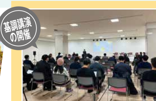
観光まちづくりシンポジウム [meet & talk 面白い事例を学び、前橋の未来を考えよう]