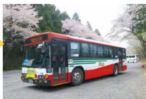
赤城南麓花めぐり号