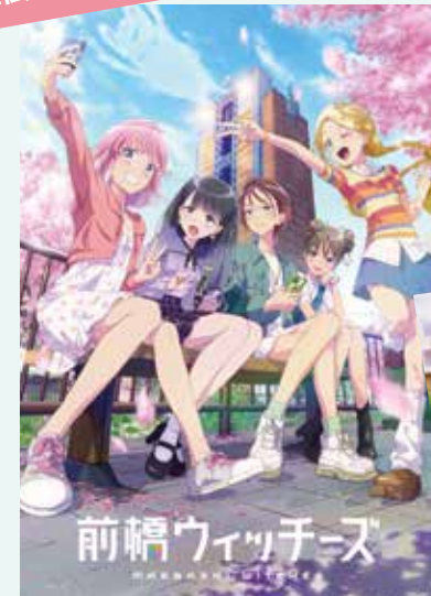
TVアニメ『前橋ウィッチーズ』