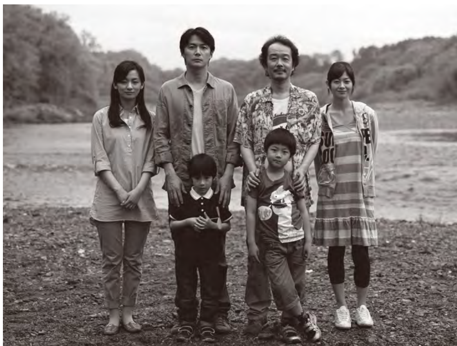
『そして父になる』 10月5日(土) 新宿ピカデリー他全国ロードショー

本協会が行っているフィルムコミッション事業でサポートした作品である福山雅治さん主演の映画「そして父になる」(是枝裕和監督)が、第 66 回カンヌ国際映画祭にて審査員賞を受賞いたしました。