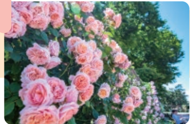
バラ (敷島公園ばら園)