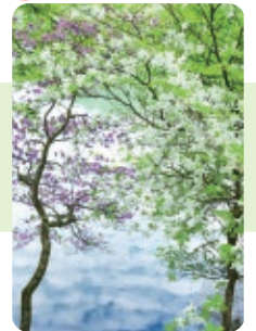
シロヤシオ・トウゴクミツバツツジ (小沼周辺)